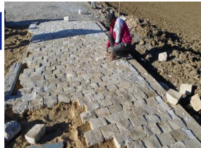
Tunis, Tunisie, 14 - 16 Novembre 2018 à l'hôtel Golden Tulip El Mechtel Tunis

Les bonnes pratiques pour les terrassements et les routes rurales